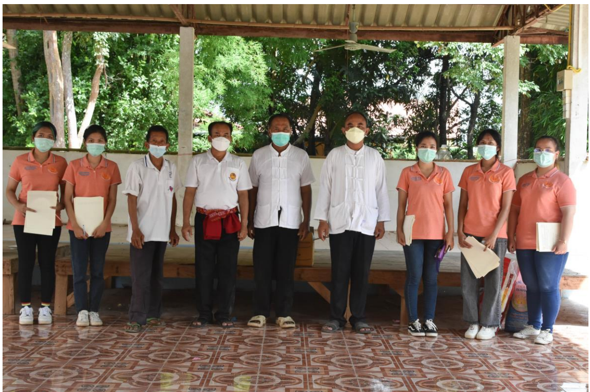
ภาพที่ 4.1 ทีมงานนักวิจัยลงพื้นที่แจกแบบสอบถามในเขต องค์การบริหารส่วนตำบลหนองเหล่า (1)

สุดท้าย ด้านการทำแบบสำรวจและประเมินความพึงพอใจในการให้บริการขององค์กรปกครองส่วนท้องถิ่น พบว่า กลุ่มตัวอย่างส่วนใหญ่ไม่เคยทำแบบสอบถามประเมินความพึงพอใจการให้บริการขององค์กรปกครองส่วนท้องถิ่น ร้อยละ 64.0 และเคยทำแบบสำรวจและประเมินความพึงพอใจในการให้บริการขององค์กรปกครองส่วนท้องถิ่น ร้อยละ 36.0 ตามลำดับ รายละเอียดตามตารางที่ 4.2